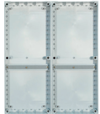
Bloc de raccordement

À ce bloc doivent être raccordés les sectionneurs 125 A (125 ampères) placés dans chaque module de raccordement.